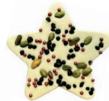
L'étoile (Chocolat blanc)