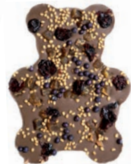
Le nounours (Chocolat lait)