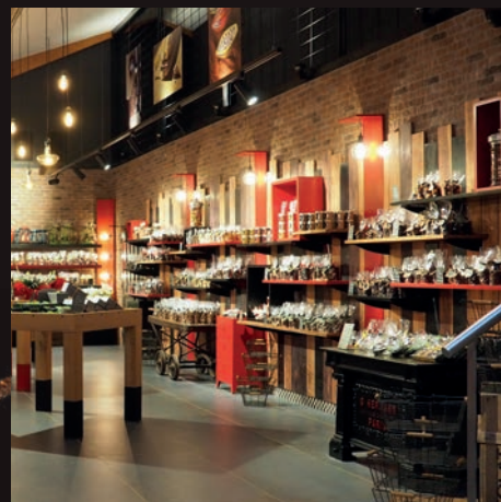
FABRIQUE - MUSÉE - BOUTIQUE à Cambo