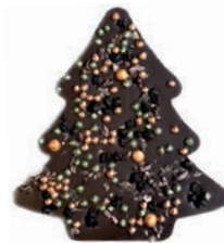
Le sapin (Chocolat noir)